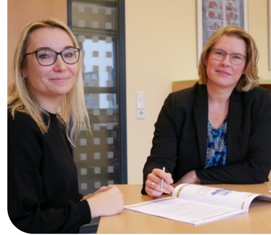
Im Landkreis Oder-Spree werden Informationen transparent und sichtbar gemacht.

Aber auch wichtige Akteur*innen, wie die Agentur für Arbeit, sind unsere Partner*innen, nehmen uns mit und lassen uns teilhaben. Und die Kolleg*innen